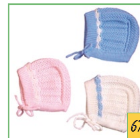
Шапочка АРТ.67 Цвета: голубой, розовый, белый с розов. или голуб. Два размера: 38, 42 Состав: 50%-шерсть, 50%-акрил