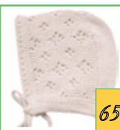
Шапочка АРТ. 65 Три цвета: белый, голубой, розовый 50%-шерсть 50%-акрил Два размера: 38, 42