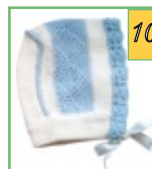
Шапочки для новорождённых АРТ. 9 и АРТ.10 Три цвета: белый, голубой, розовый 50%-шерсть 50%-акрил Один размер: 38

Шапочки-чепчики, связанные с применением бесшовной технологии